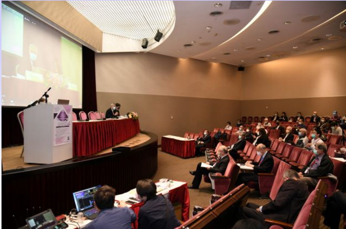
圖三、第四屆亞太醫用超音波新進展國際論壇會場概況。