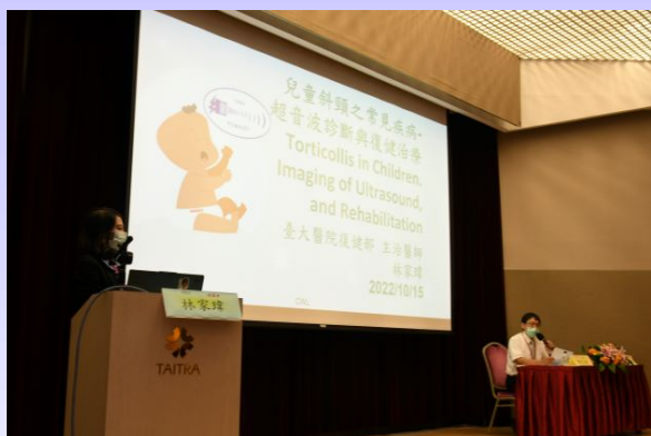
圖七、骨骼肌肉系統學超音波研討會。