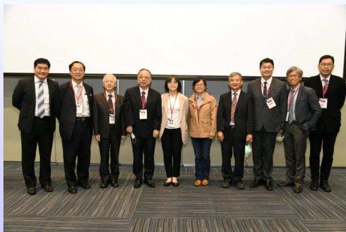
圖十二、小兒科超音波研討會。