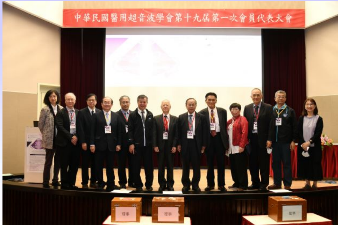
圖五、學會於 10 月 16 日召開第十九屆第一次會員代表大會，會中投票選舉理事、監事。