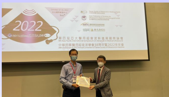
圖八、外科超音波研討會。