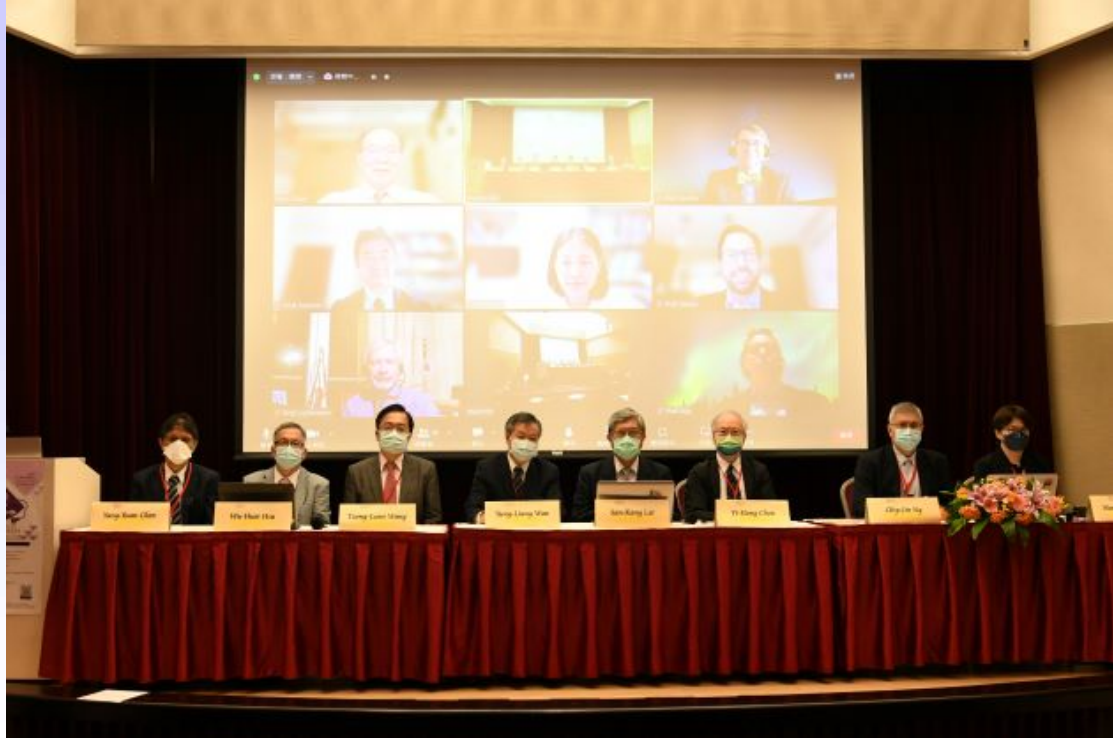
圖一、第四屆亞太醫用超音波新進展國際論壇於 10 月 15 日上午在台北國際會議中心舉辦，相較 2021 年，台灣新冠疫情已趨緩，大會採實體舉辦，但所有外賓仍採視訊與會。