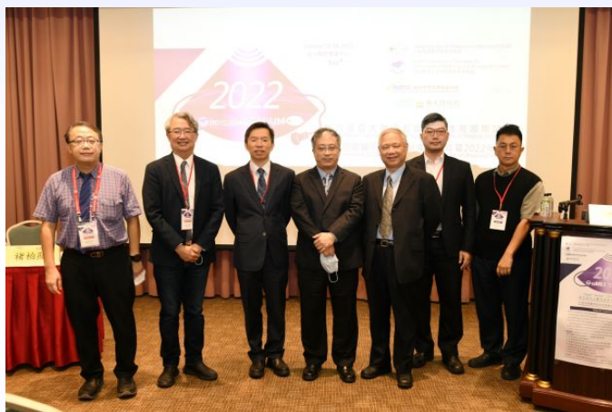
圖十、心臟科超音波研討會。