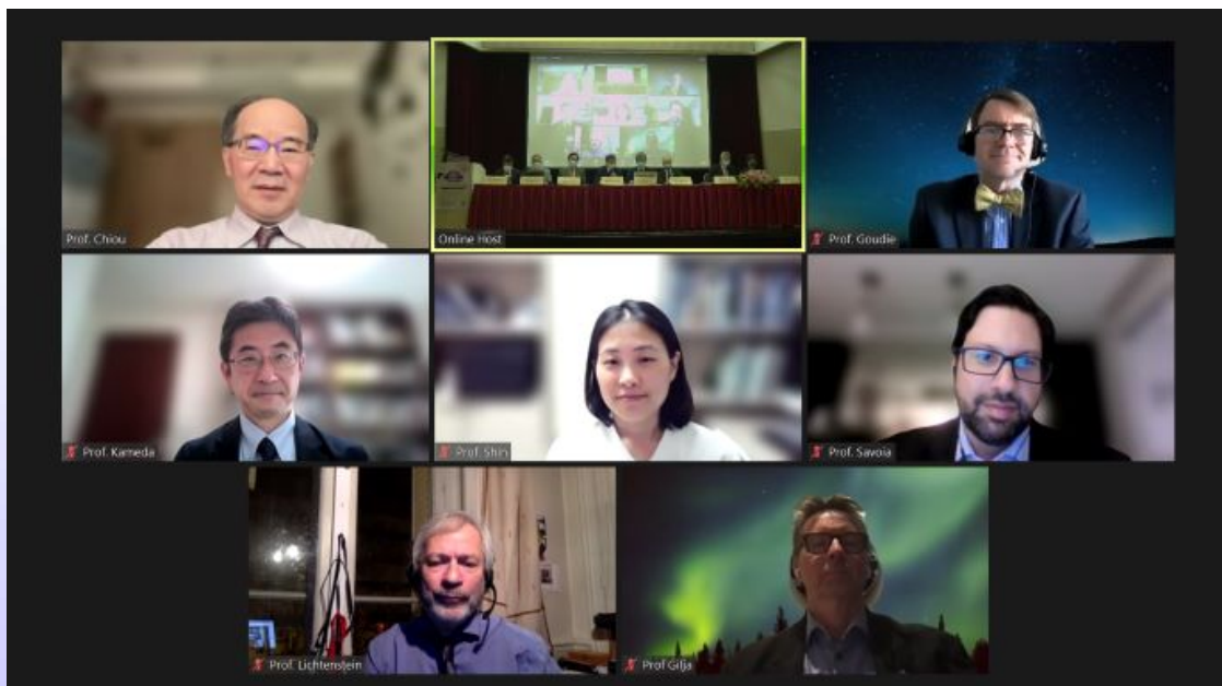
圖二、第四屆亞太醫用超音波新進展國際論壇，外賓採視訊出席，也方便國內演講者及座長因大會期間確診居隔時，也能以視訊同步與會。