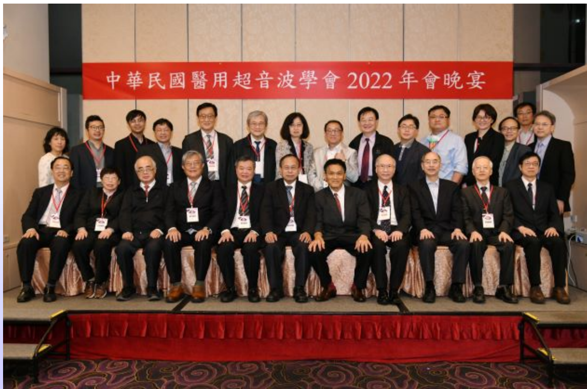
圖四、10月15日年會第一天活動結束，晚上依往例舉辦晚宴宴請大會座長、演講者及會員代表，